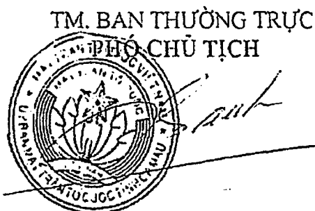
Phan Mộng Thành